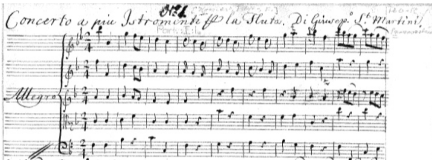
Obr. 4: Giuseppe Sammartini. Koncert F dur.