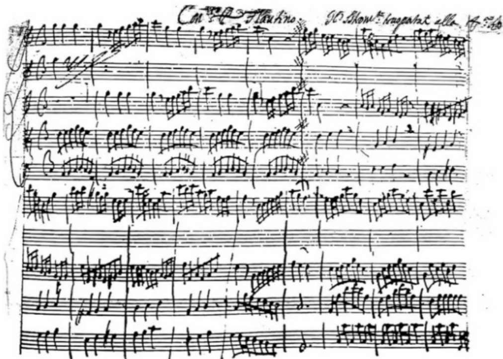
Obr. 1: První strana Koncertu C dur RV 443 Antonia Vivaldiho.