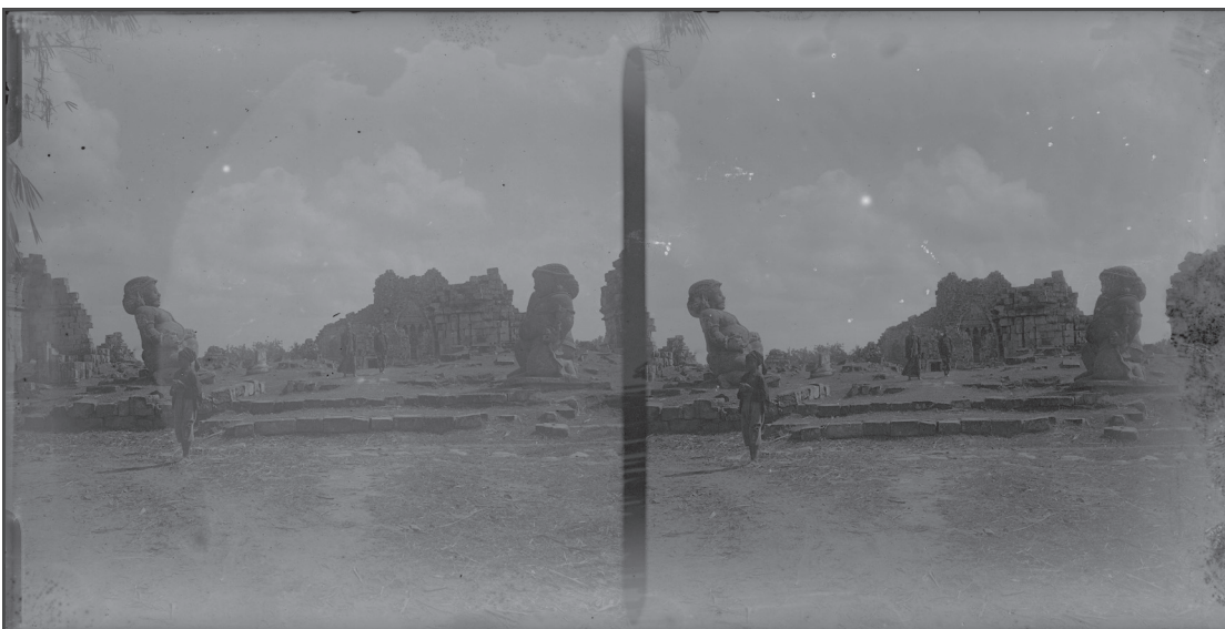
Obrázek 12: Chrám Candi Sewu, Jáva, Indonésie 54