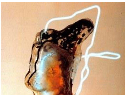
Zdeněk Pešánek: Mužské a ženské torzo (světelná plastika)

Teoretické dílo Kinetismus mělo v několika aspektech vyjádřit autorovo přesvědčení, že výrazovými prostředky budoucího umění se stanou především světlo a pohyb, které dříve statické výtvarné umění přiblíží poezii, hudbě a tanci.