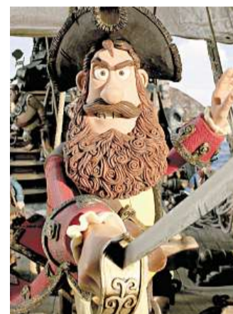
Souboj tří Animovaný Alois Nebel se utká se snímky Vrásky (vlevo dole) a Piráti! .